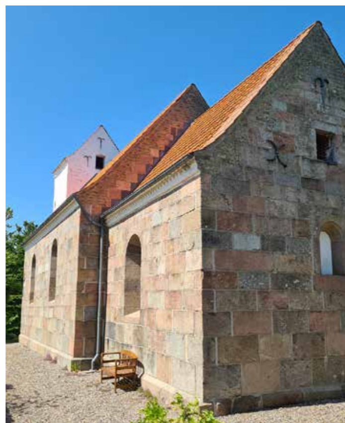
Torup Kirke ligger højt og flot med udsigt til Rold Skov.