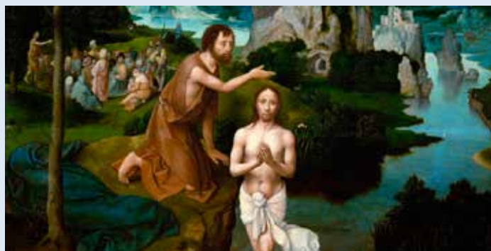
Kristi dåb malet af den hollandske maler Joachim Patenier (1480-1524)

Årets længste dag i 2024 er den 20. juni, hvor dagslængden er 18 timer, 6 minutter og 3 sekunder i Skagen – Danmarks nordligste lokalitet. Dagen kaldes også sommer-solhverv. Få dage senere den 23. juni er det sankthansaften, hvor vi fejrer midsommer med bål, taler, sang og hyggeligt samvær under åben himmel. Det er en tilbageværende tradition, der fortrinsvis fejres i de nordiske og baltiske lande, der er kendt for deres lyse nætter. Vejræssigt kan det være en blandet fornøjelse, for sankthansaften kan være både kølig og regnfuld. Når vi står samlet omkring bålet og synger Holger Drachmanns "Midsommervisen", er det nok de færreste, der ved, at sankthans har noget at gøre med Johannes Døberens.